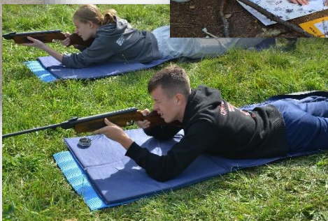
Sportovní a zážitkové programy