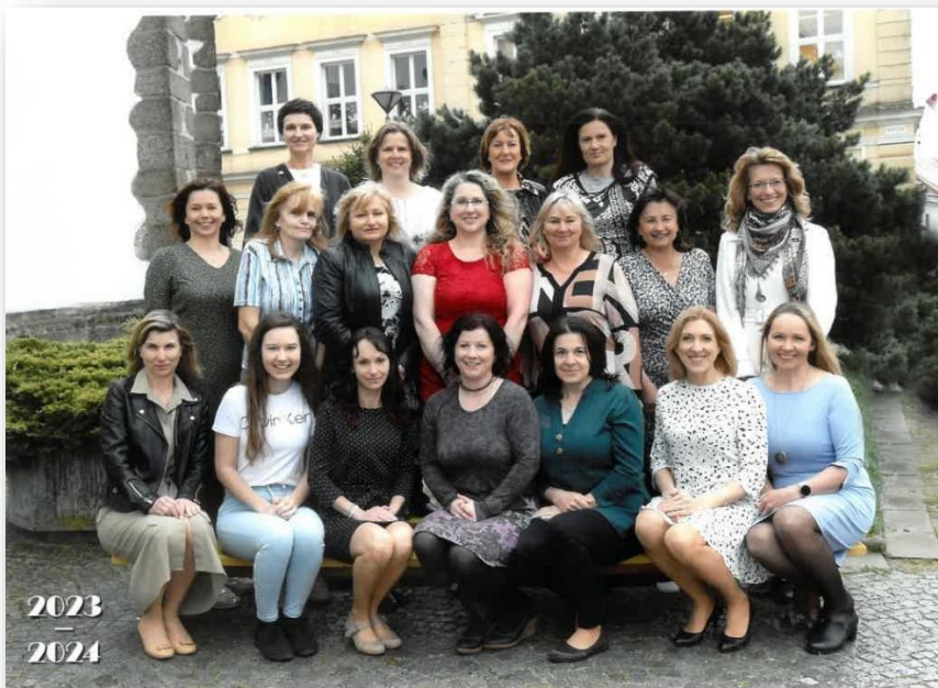
Pedagogický sbor 1. stupně